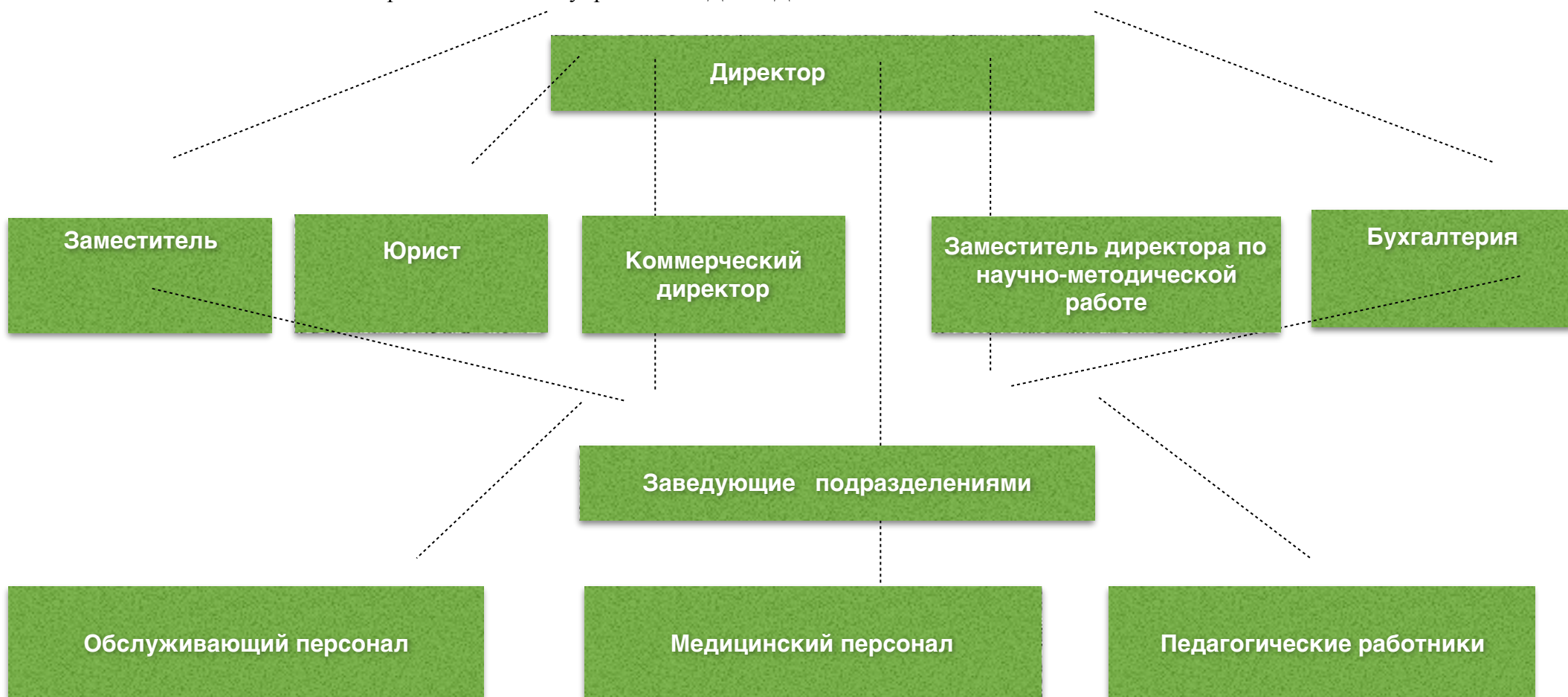
Схема № 1. Административное управление ЧДОУ «Детский сад «Умница»